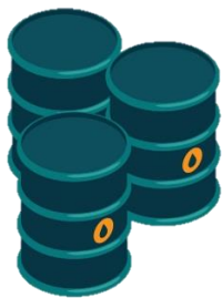
Tambos metálicos remanufacturados