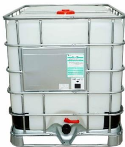
Contenedores tote de 1000 L