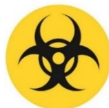
RESIDUOS PELIGROSOS BIOLÓGICO INFECCIOSOS (RPBI)