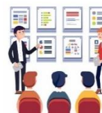
CAPACITACIÓN SOBRE MANEJO DE RESIDUOS PELIGROSOS