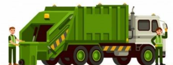
RESIDUOS DE MANEJO ESPECIAL (RME)