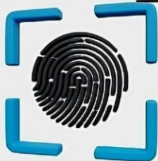
Control de Accesos