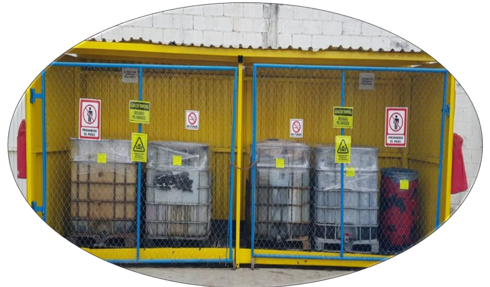
ALMACEN TEMPORAL DE RESIDUOS PELIGROSOS