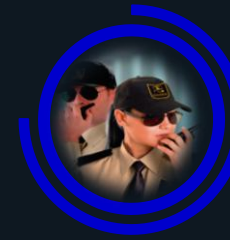
Personal de Seguridad Patrimonial