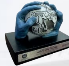
20° Premio Nacional de Seguridad Vial 2019

Gracias al cumplimiento puntual de estos procesos y al esfuerzo incansable de toda la organización, Grupo Nor y Caribe ha sido reconocido en diversas ocasiones, una de ellas fue lograr la posición No. 10 del Top 100 de Autotransporte en México en los Transportation Awards 2019 de la revista T21.