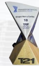
Posición No. 12 Top 100 del Autotransporte 2018