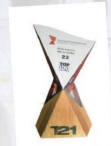
Posición No. 22 Top 100 del Autotransporte 2017