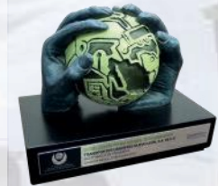
19° Premio Nacional de Seguridad Vial 2018