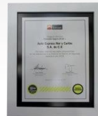
Proveedor Seguro 2018 Auto Express Nor y Caribe Ternium