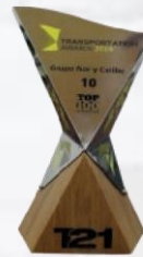
Posición No. 10 Top 100 del Autotransporte 2019