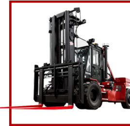
Taylor (10 tn a 20tn)