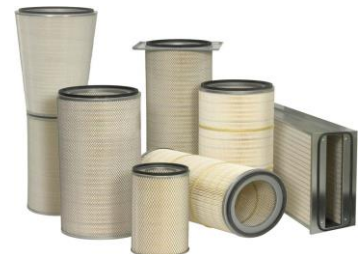
Filtro Colector de Polvo