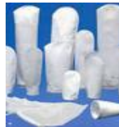
Filtros para Líquidos