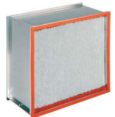
Filtros HEPA ALTA TEMP