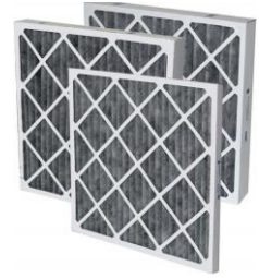
Filtros CARBON ACTIVADO