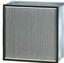
Filtros HEPA & ULPA