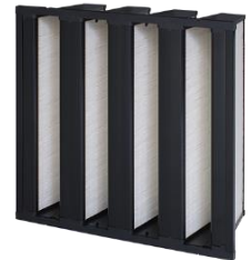
Filtros para ALTO FLUJO