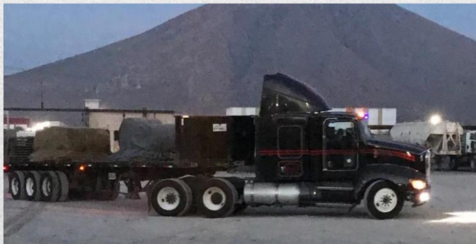
ACERO DE AHMSA