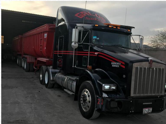
CARBON DE COERSA